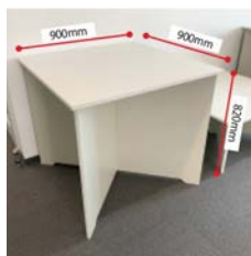
③展示台 W900×D900×H820 mm