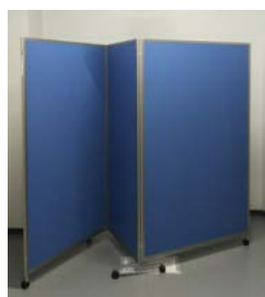
②パーティション (3連) 2台のみ W1200+900+1200×H1800 mm