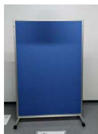
①パーティション W900×H1800 mm

発表者決定後、作品・展示に関するお知らせ・問合せを、実行委員会よりご連絡いたします。